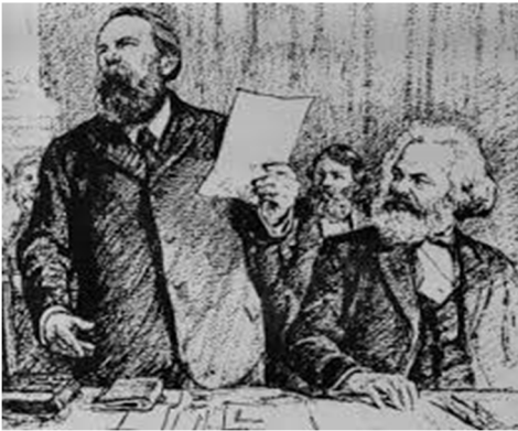
Engels ja Marx