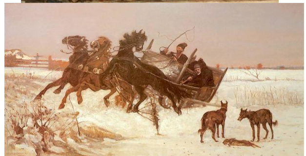
Millise riigi kunsti näidiseid Te näete